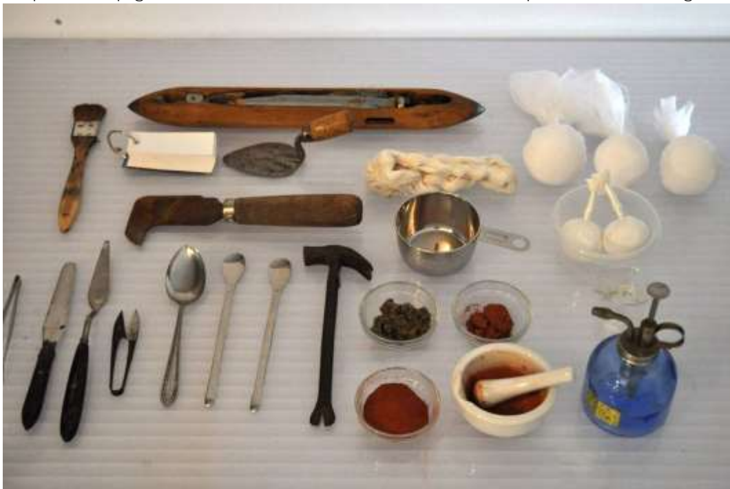
Atelier Tonokura, open studio « crossing view » à Echangeur22