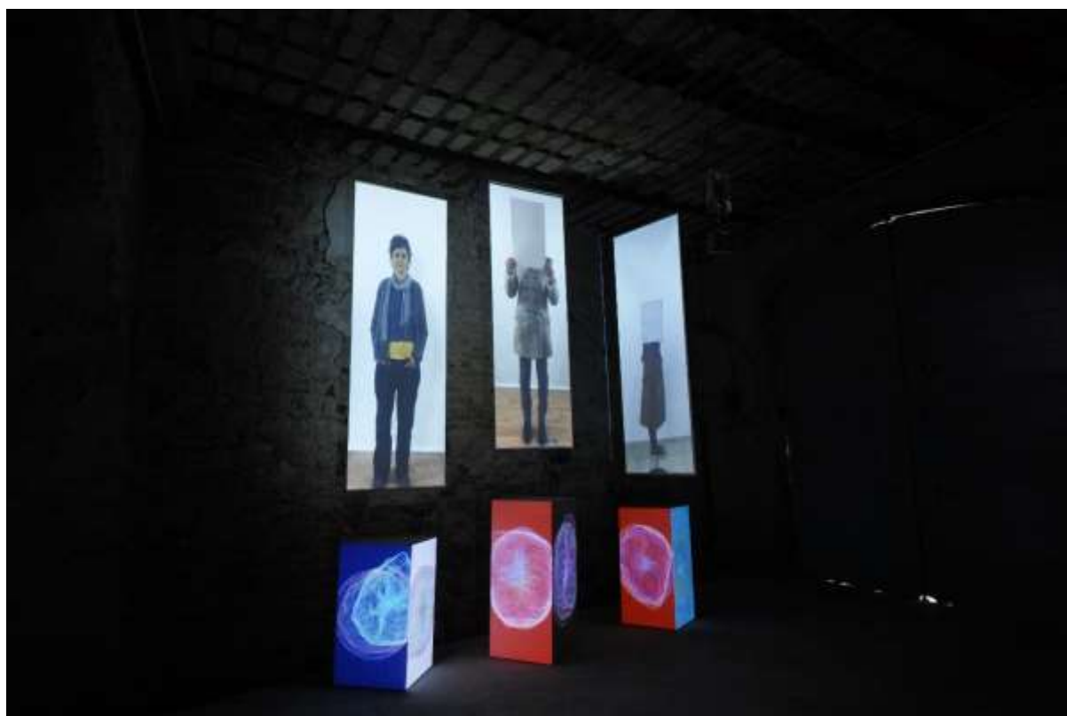
Installation « it's not our fault », open studio à Echangeur22, Mai 2017.

C'est l'écart culturel que l'artiste a voulu mesurer, en visualisant les architectures et paysages des effets du sexisme en France côte à côte avec celles déjà récoltées en Corée.