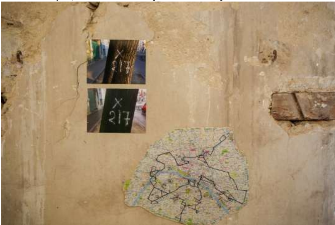
Atelier Won Jy, open studio « crossing view » à Echangeur22