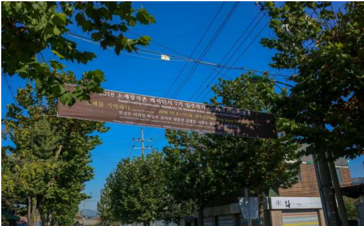
Le 3 Novembre 2018, Echangeur22 a été invité à s'exprimer sur son expérience d'échanges internationaux en relation avec le réseau local.