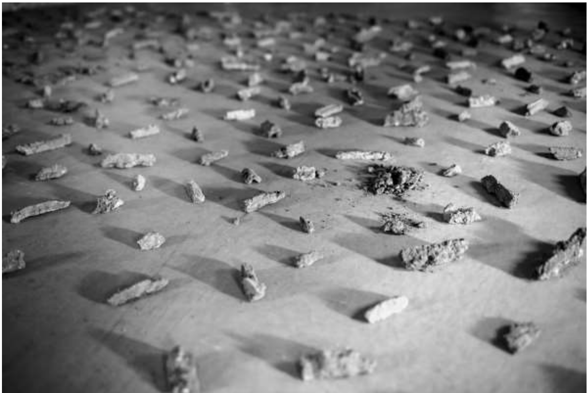
Installation, empreintes de terre, open studio « crossing view » à Echangeur22

Sur ce pont, dans ce glissement de pensée, j'ai également essayé d'esquisser un projet pour l'exposition organisée à Tokyo par E22 qui suivra très directement le séjour coréen. Plus particulièrement, comment profiter des 2 semaines au Japon pour réinvestir les gestes et les pratiques développées à Saint-Laurent-des-arbres dans un contexte si différent. Envisager leur portée nouvelle, leur signification modifiée, la manière dont ils pourront négocier avec un autre territoire et une autre culture. »