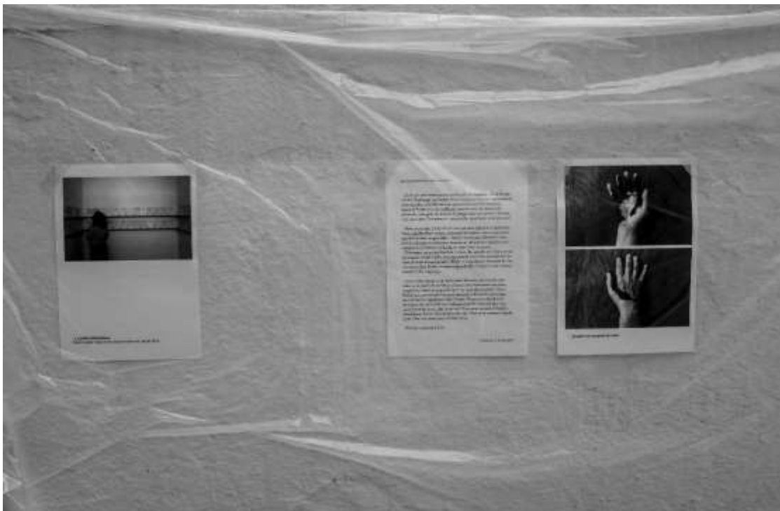
Installation textes et photos, open studio « crossing view » à Echangeur22

Pendant les deux semaines de résidence échange à Echangeur22 avec Sanghee Noh, Guillaume Barborini a posé les bases du travail qu'il compte développer en Corée, à SCC en Octobre.